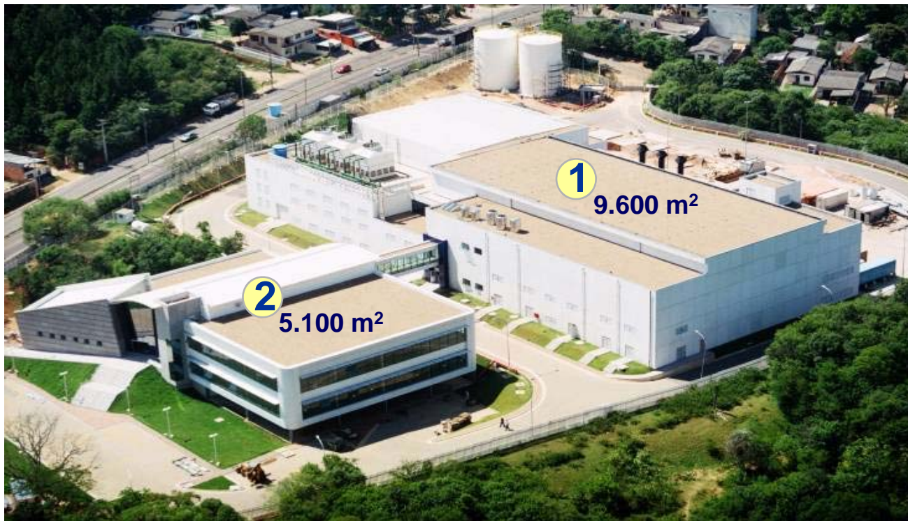
Vista das instalações em Porto Alegre

Empresa pública, especializada no desenvolvimento e produção de circuitos integrados de aplicação específica (ASICs), com vistas a atender necessidades de mercado com alto padrão de qualidade,