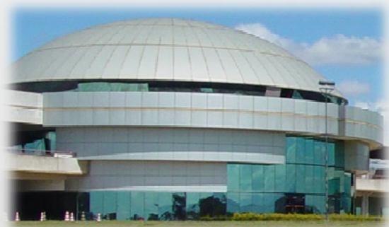
São José Dos Campos

São José do Rio Preto Sorocaba Piracicaba Santos Araçatuba Guarulhos Botucatu