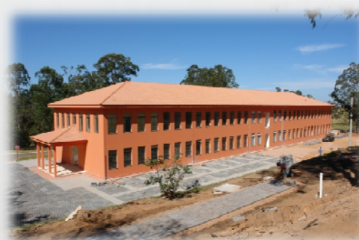
São Carlos - ParqTec